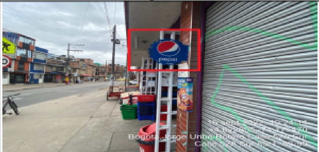
En la cual se evidencia un (1) elemento publicitario perteneciente a la sociedad CUBILLOS & CAGUENAS SAS , el cual se encuentra volado de la fachada y es adicional al único elemento permitido por fachada de establecimiento.