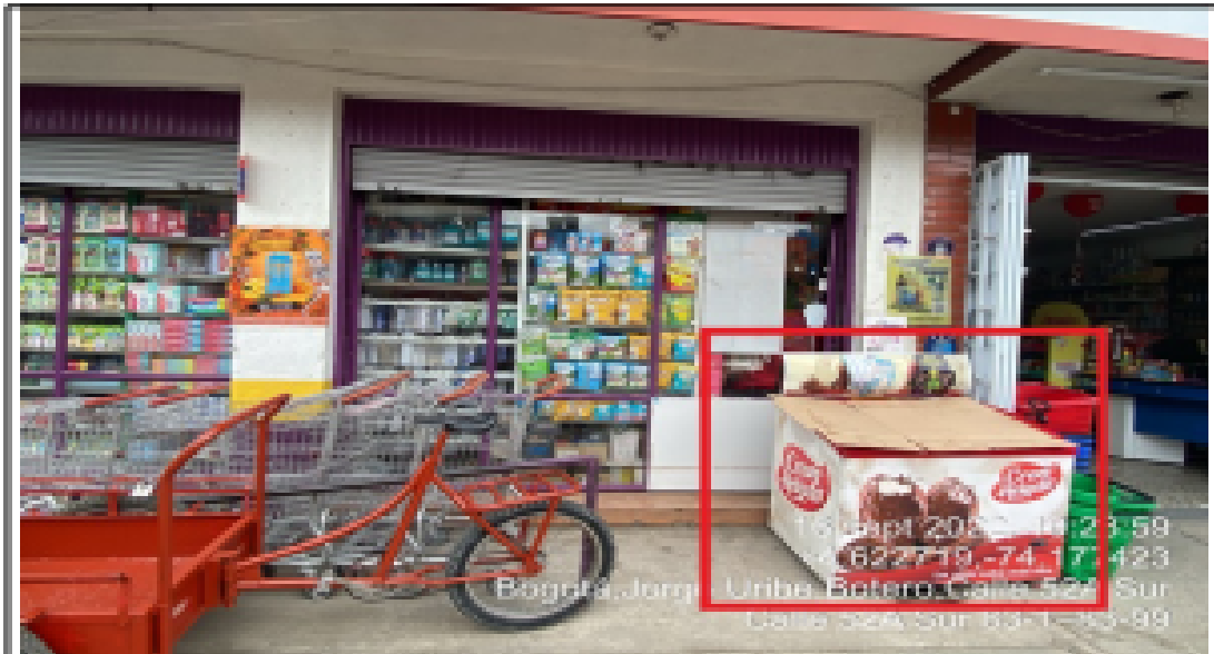
En la cual se evidencia un (1) elemento no regulado con Publicidad Exterior Visual, perteneciente a la sociedad CUBILLOS & CAGUENAS SAS , el cual se encuentra ubicado en área que constituye espacio público.